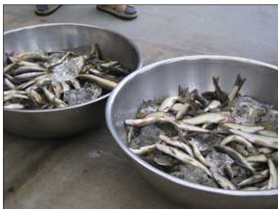
ボールに移された鮎